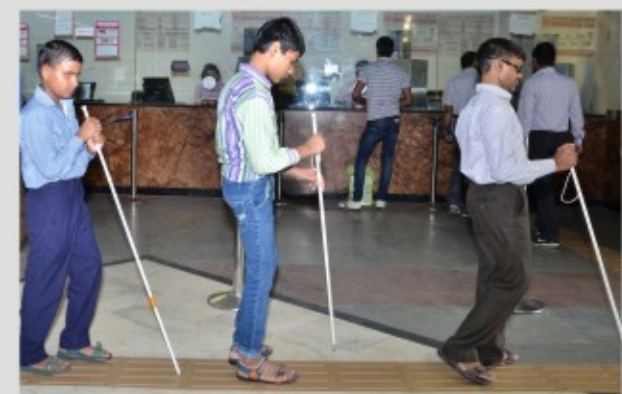
दृष्टि बाधितों के लिए टेक्टाइल मार्ग