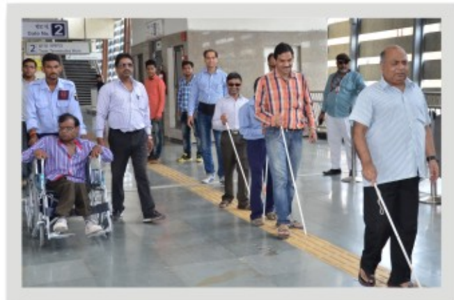
बाधा रहित मेट्रो यात्रा समाप्ति पर सुखद अनुभूति