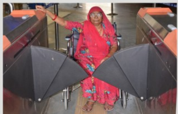
अधिक चौड़ाई के प्रवेश/निकास फ्लेप गेट