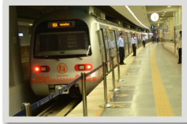
प्लेटफार्मों पर भी दृष्टिबाधितों के लिए टेक्टाइल मार्ग