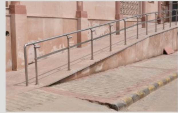
पब्लिक रोड़ से स्टेशन प्रवेश के लिए रेलिंग के साथ रेम्प

It is the nationwide flagship campaign for achieving universal accessibility for all citizen including Specially Abled persons, to be able to gain access for equal opportunity and live independently, and participate fully in all aspect of life in an inclusive society. The Campaign targets at enhancing barrier free access to all public buildings and transportation.