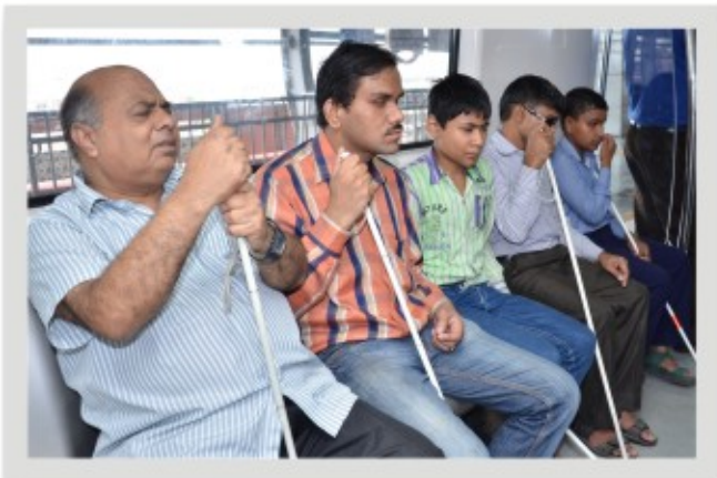
मेट्रो ट्रेन में यात्रा का अनूठा अनुभव

ट्रेन में व्हील चेयर के साथ यात्री आरक्षित स्थल