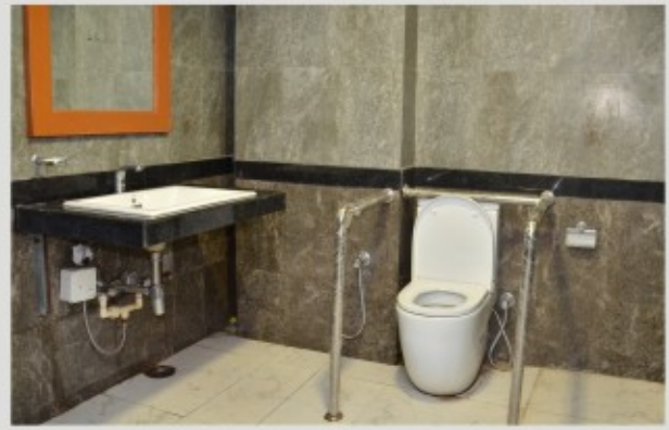
पूर्ण सुविधा के साथ विशेष योग्यजन शौचालय