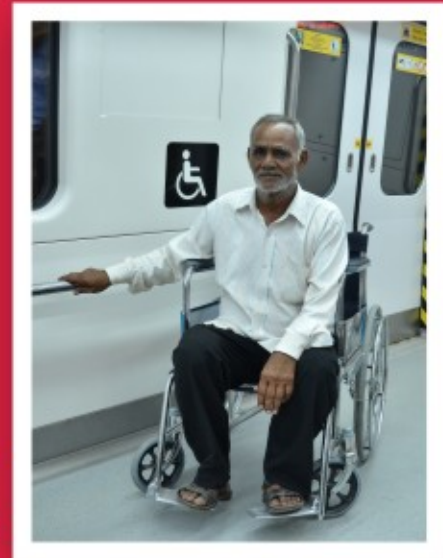
ट्रेन में व्हील चेयर के साथ यात्री आरक्षित स्थल