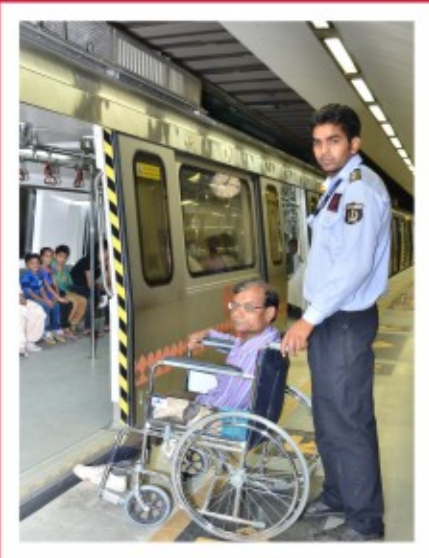
व्हील चेयर यात्री की सेवा में ग्राहक सहायक